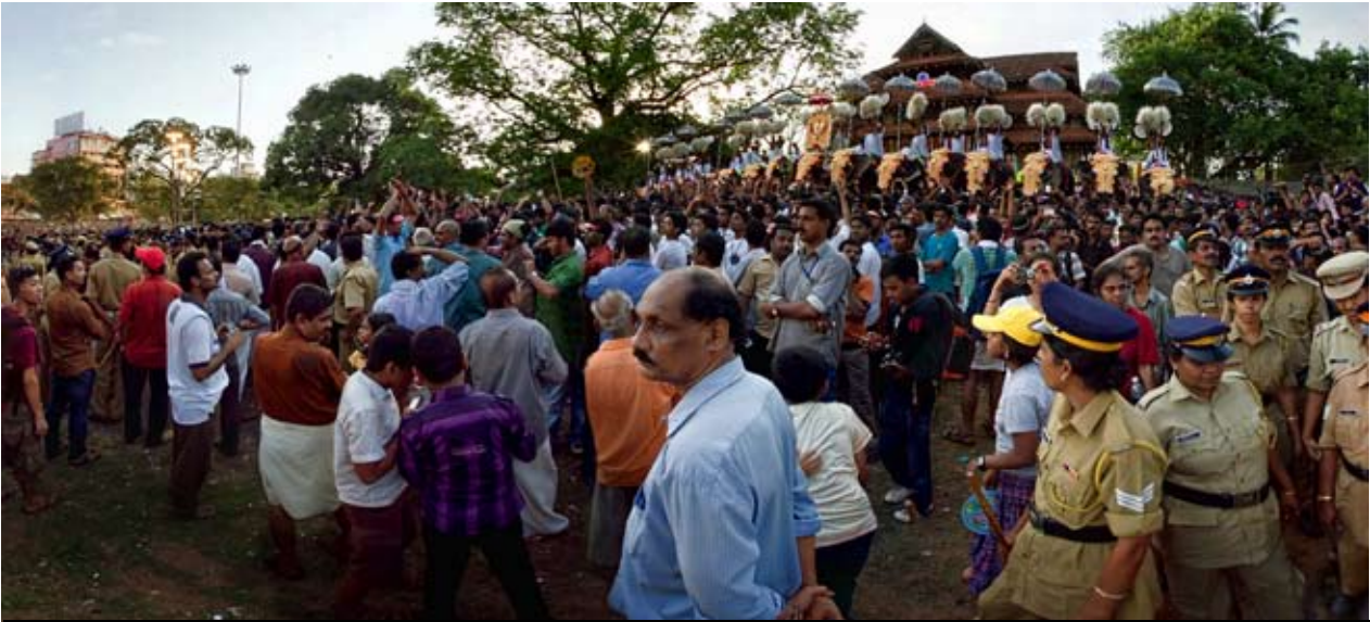
തൃശൂർ പൂരം, സൂം ചെയ്താൽ ഓരോരുത്തരെയും സ്പഷ്ടമായി കാണാം.