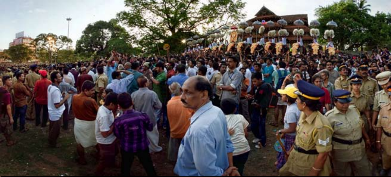
തൃശൂർ പൂരം, സൂം ചെയ്താൽ ഓരോരുത്തരെയും സ്പഷ്ടമായി കാണാം.