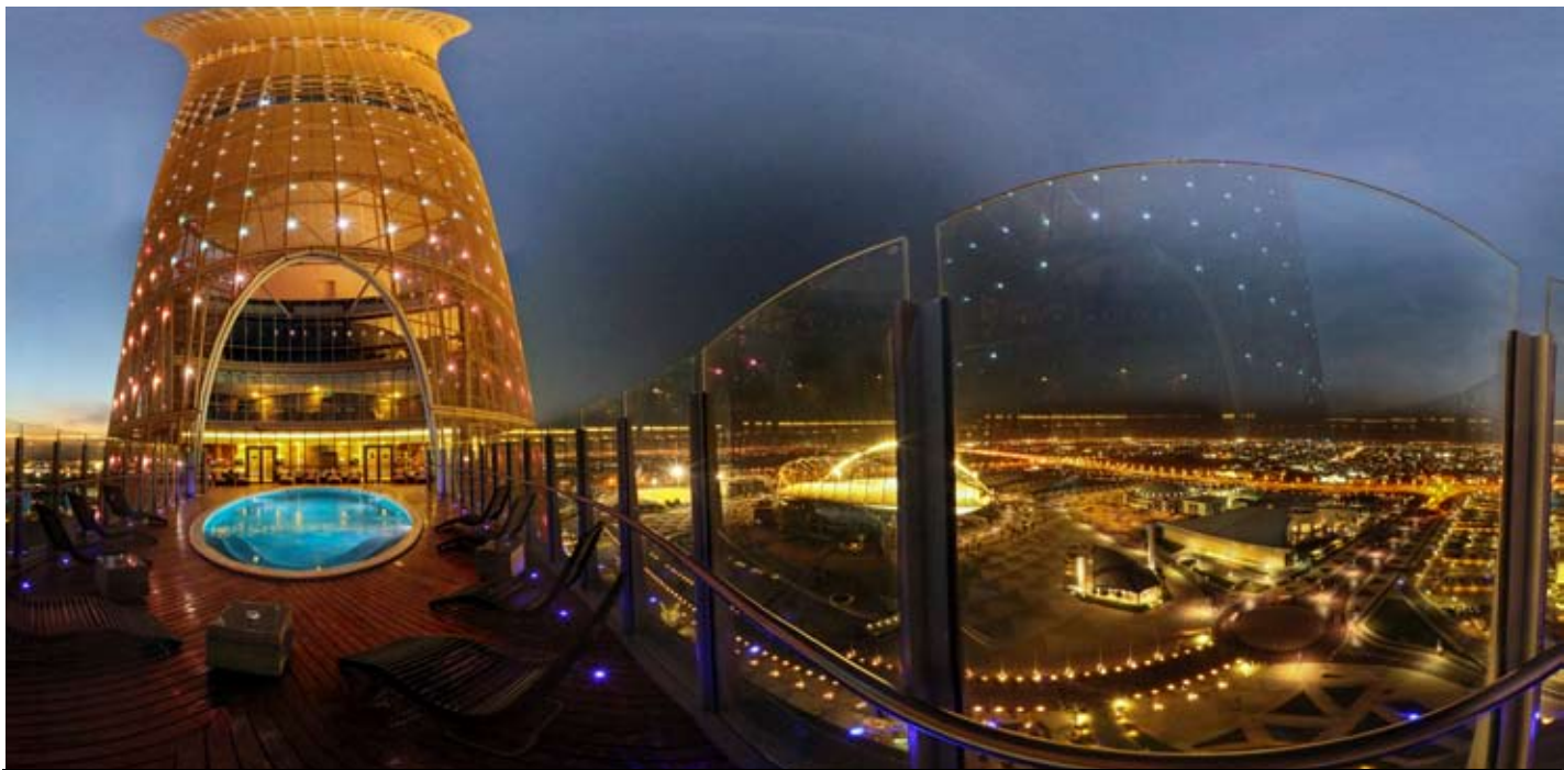
ടോർച്ച് ഹോട്ടൽ, ദോഹ. 47 നിലകളുള്ള ദോഹയിലെ ഏറ്റവും വലിയ ഹോട്ടൽ