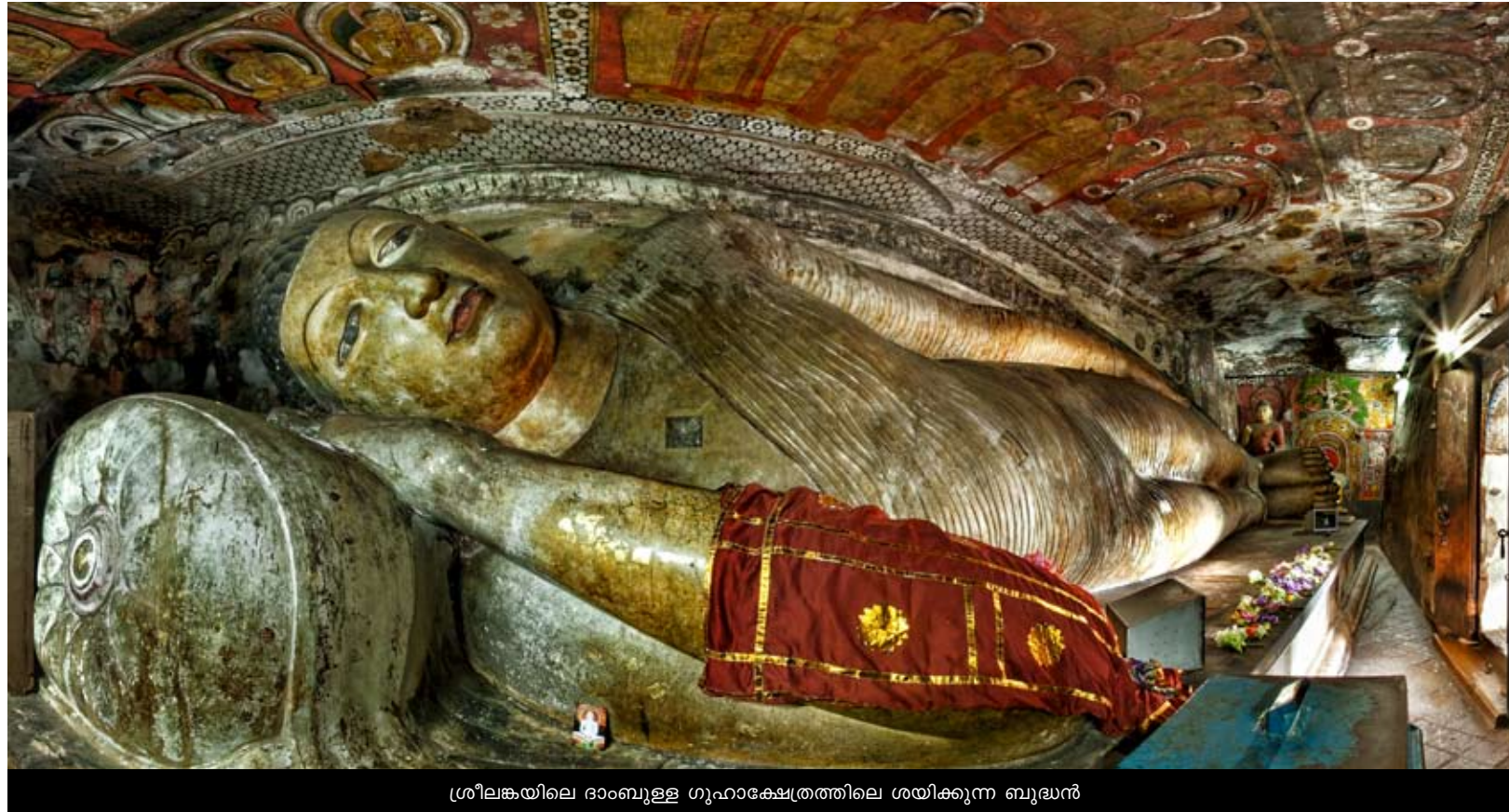
ശ്രീലങ്കയിലെ ദാംബുള്ള ഗുഹാക്ഷേത്രത്തിലെ ശയിക്കുന്ന ബുദ്ധൻ

പാശ്ചാത്യലോകത്ത് എഫ്ഐബി ഇതിനെ ക്രൈം ഫോട്ടോഗ്രഫി എന്നാണ് വിളിക്കുക. ക്രൈം സ്പോട്ടിന്റെ സമ്പൂർണ്ണ രംഗങ്ങളും പൊലീസ് ഫോട്ടോഗ്രാഫർ 360 ഡിഗ്രി ചിത്രങ്ങളിൽ ഷൂട്ട് ചെയ്യുന്നു. അന്വേഷണോദ്യോഗ സ്ഥൻ മാറിയാലും മാറാത്ത തെളിവുകൾ