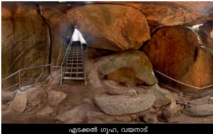
എടക്കൽ ഗുഹ, വയനാട്

ചേർത്ത് തയ്യാറാക്കുന്ന ഒരു ഫ്രെയിമിന് ഒരു പനോരമ എന്നാണ് പറയുക. സോമതീരം റിസോർട്ട്, റാംദാ റിസോർട്ട്, റാവീസ്, ബാഹ്റൈൻ അറ്റ്ലസ് ജല്ലറി, എന്നിവകളുടെ പനോരമകൾ വന്നതോടെ ബിസിനസ് രംഗത്ത് കൂടുതൽ റിസോർട്ടുകളും ഹോട്ടലുകളും റിയൽ